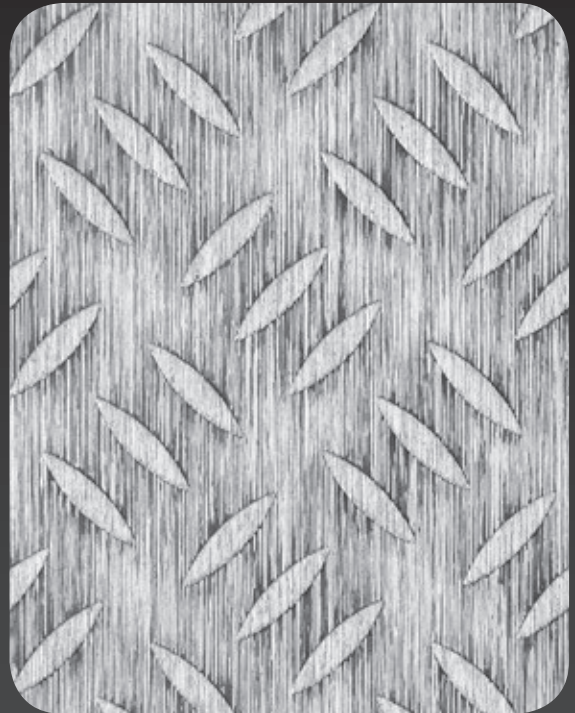
SE-TB1 604 (R12)