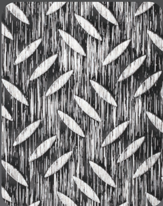
SE-TB1 636 (R13)